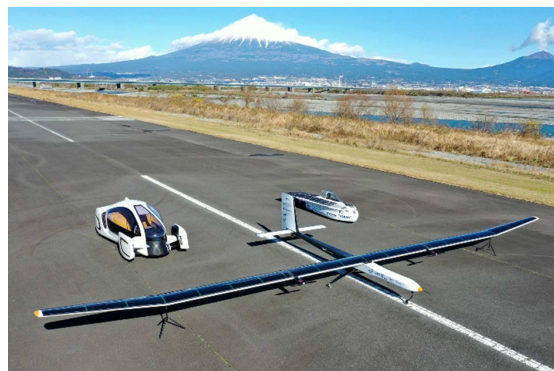
写真3 ソーラーカー UAV の外観