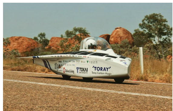
写真1 オーストラリアのデビルス・マーブルスを走行する23新型ソーラーカー Tokai Challenger

空力評価は本学工学部航空宇宙学科の福田紘大教授の研究室と共同で実施し、両立することが難しい空力と発電のバランスを考慮しながら、性能の最大化を図っている。これら进行评估するために、キャンピー影を考慮した発電シミュレーション、CFD解析を交互に行い、3D CADモデルの修正が繰り返される。CFRPボディの開発は、東レおよび東レ・カーボンマジック社等と進めている。これに企業のエンジニア、卒業生なども加わり、独自の産学連携体制が築かれている。